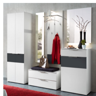
Ein echtes Highlight in Ihrer Diele: Lack Weiß kombiniert mit Absetzung in Glas Anthrazit satiniert.