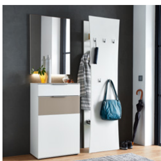
Setzen Sie neue Akzente mit Front in Lack Weiß u. mit Garderobenpaneel in moderner Optik.