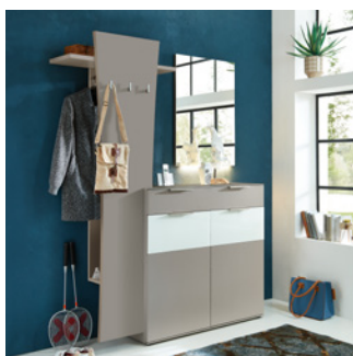
Trendiges Garderobenelement setzt neue Akzente in Ihrer Diele.