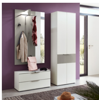
Kleine, moderne Dielenlösung mit dimmbarer Beleuchtung.