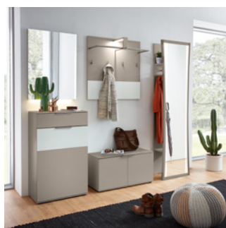
Diese Dielenkombination bietet Stauraum für alles.