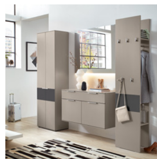
Ein wohnliches Ambiente in Lack Fango mit Absetzung in Glas Anthrazit satiniert.